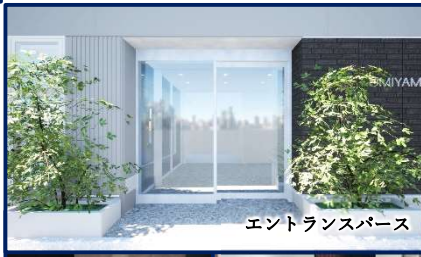
エントランスパース

総額賃料 賃料 相談 敷金 12ヵ月 ※契約時償却2ヵ月 礼金 無 更新料 無 契約期間 2年間 (普通賃貸借) 解約予告 6ヵ月 専有面積 46.55坪 備 男女性別トイレ 機械警備 OAフロア 天井高2,600mm エレベーター1基(不停止機能有)