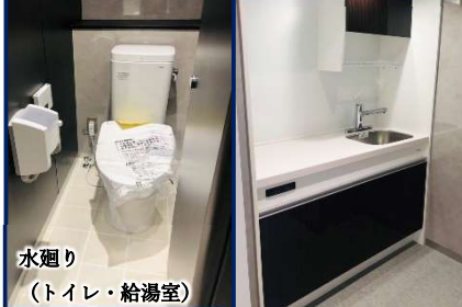
水廻り (トイレ・給湯室)